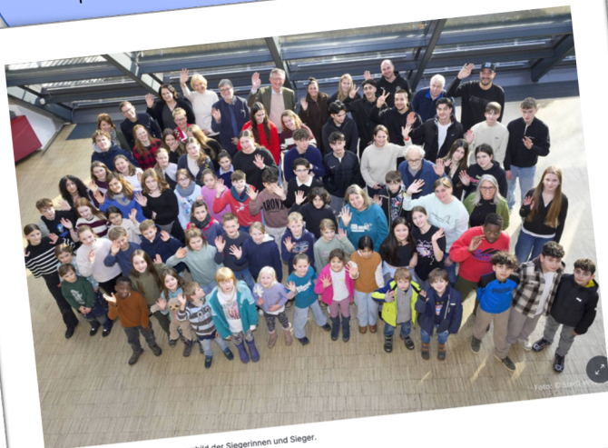
Das Gruppenbild der Siegerinnen und Sieger.