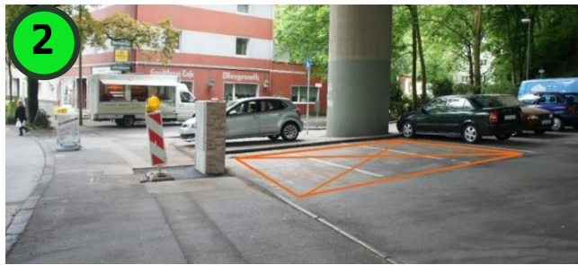
2 Hol- und Bringzone Varresbecker Straße