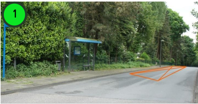
1 Hol- und Bringzone Sillerstraße