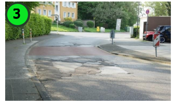
3 Diese Überquerungshilfe soll genutzt werden, um die Straße sicher zu überqueren. Bitte meiden Sie die ungesicherte Kreuzung an der Kirchhofstraße.