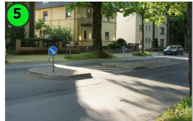
5 Achtung: Nur bei ausreichender Übung ist die Mittelinsel geeignet.